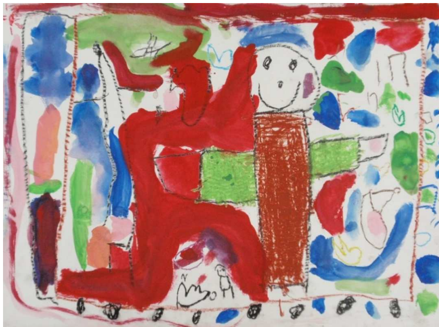
「大男も乗れるバス」