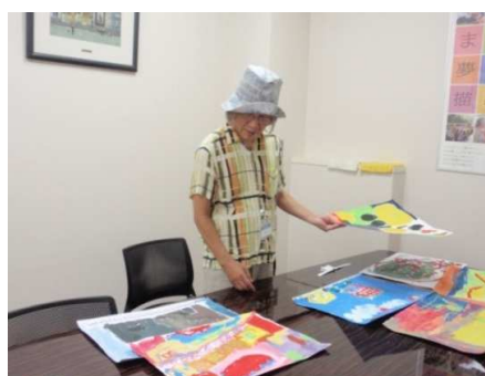
選考中の土器先生と作品たち